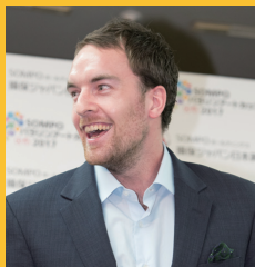
ザックバランスキー選手